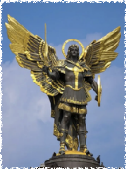
Statue of St. Michael the Archangel that stands above Kyiv's Independence Square. St. Michael is patron saint of the Ukrainian capital.